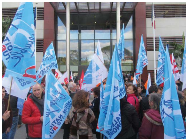
Devant l'Agence Régionale de Santé à Montpellier, le 30 janvier dernier

L'UNSA Santé Sociaux et l'UNSA Territoriaux sont fortement engagées dans ce mouvement social auquel l'UNSA Retraités apporte son soutien comme elle l'avait déjà fait le 30 janvier dernier.